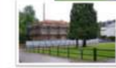
Edificio del siglo XVII del Living Lab (en restauración)